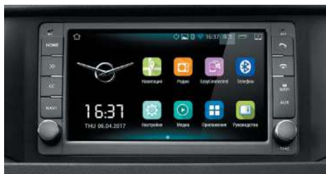
Современная мультимедиа система